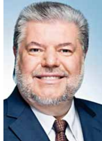
Kurt Beck, Ministerpräsident in Rheinland-Pfalz, geißelte die Schnellschüsse als „populistisch und vordergründig“. Sie entspringen „der Hilflosigkeit und dem Drang, wahrgenommen zu werden“, sagte der SPD-Politiker dem Hamburger Abendblatt.

In Zukunft nur noch Olympisches? So mancher Sportschütze fürchtete nach öffentlichen Äußerungen Josef Ambachers, dass der DSB-Chef die Großkaliber-Disziplinen komplett aufgeben will.