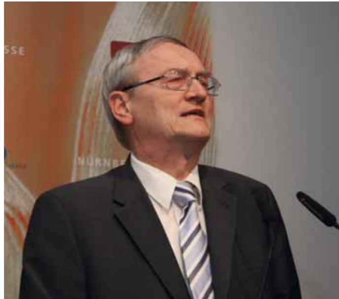
Dr. August Hanning, Staatssekretär im Bundesinnenministerium besuchte trotz der Ereignisse in Winnenden die Nürnberger IWA – und erklärte, daß die Messe keine Waffenverherrlichung sei.

Auch den Großkaliber-Schießsportlern soll es an den Kragen gehen: Bremens Innensenator will – wie andere Politiker auch – nicht nur das vom Bundesverwaltungsamt als Disziplin genehmigte IPSC-Schießen abschaffen, sondern am liebsten das Großkaliber-Schießen insgesamt beseitigen: „Grundsätzlich sollte gelten, das Schusswaffen, die bei der Polizei oder beim Militär eingesetzt werden, im Schießsport nichts zu suchen haben. Auf welche Weise dies geregelt wird (z.B. Kaliberbegrenzungen, Begrenzung der Konstruktion; Beschränkung des Schießsports auf Luftpistole/-gewehr und Kleinkaliberwaffen) wäre noch zu erörtern. Jedenfalls sollte im Ergebnis eine wirksamere Begrenzung als bisher im Schießsport für solche Waffen eingeführt werden. Dies sollte auch unabhängig davon gelten, ob bestimmte Schießsportordnungen in anderen Ländern oder international gelten. Die Verbände haben es letztlich in der Hand, durch das Schaffen immer neuer Schießsportordnungen, die sie selbst gestalten kön-