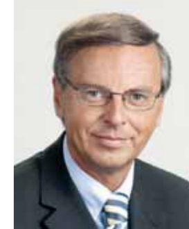
Wolfgang Bosbach (CDU) fordert Blockiersysteme.

Andere Verbandschefs sehen scheinbar in der zwangsweisen, gesetzlichen Einführung von biometrischen Blockiersystemen für jede (legale) Waffe die Rettung. Was nichts anderes bedeuten würde als Kosten von bis zu 199 Euro pro Lauf (nicht pro Waffe!) – zu bezahlen nicht vom Verband, sondern vom jeweiligen Besitzer, versteht sich. Der Grund ist einfach: Der einzige Anbieter solcher „mechatronischen“ Waffen-Blockiersysteme ist die Firma Armatix. Sie würde wohl eine Monopolstellung erhalten, da sie ihre Produkte mit mehreren Patenten geschützt hat und der Gesetzge-