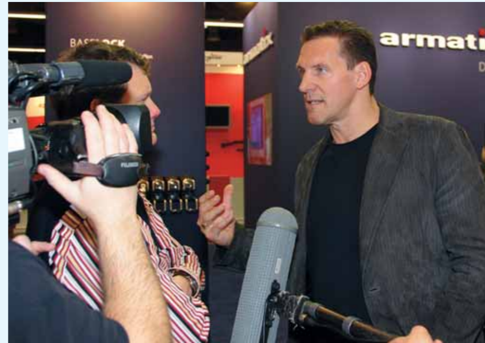
Armatix bot den deutschen Schauspieler Ralf Möller („Gladiator“) auf. Der B-Promi ertete im Jahr 2007 heftige Kritik, weil er in der Verfilmung des Ego-Shooters „Postal“ mitwirkte.

vorzuschreiben. Fragt sich nur, ob das wirklich einen Gewinn für die öffentliche Sicherheit darstellt. Jedes Blockiersystem lässt sich schließlich mit einem bestimmten Aufwand knacken – und Amokläufer handeln nicht im Affekt, sondern planen ihre Tat in der Regel sorgfältig und nehmen sich für die Vorbereitungszeit. Völlig nutzlos wäre ein Blockiersystem wohl im Fall Winnenden gewesen: Wer die Waffe nicht ordnungsgemäß im Tresor verwahrt, bei dem kann man auch nicht erwarten, dass er seine Pistole mit einer Blockierung sperrt, wie verlangt.